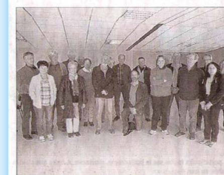
Les adhérents départementaux du GCU se sont rassemblés à Cornier pour leur réunion.

Samedi matin, dans le cadre de l'espace sportif de Cornier, les adhérents haut-savoyards du GCU, association créée à l'époque des premiers congés payés pour les universitaires, puis pour l'ensemble de la fonction publique, et maintenant aux autres secteurs économiques par parrainage, ont tenu leur réunion annuelle.