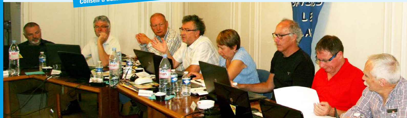
Conseil d'administration du GCU

L'administration, la direction et la gestion du GCU sont confiées à un conseil d'administration composé de 18 membres bénévoles. À l'issue de chaque assemblée générale ordinaire le conseil d'administration élit un bureau composé de 8 membres. Le bureau est chargé d'exécuter les décisions du conseil d'administration et agit sur délégation de celui-ci.