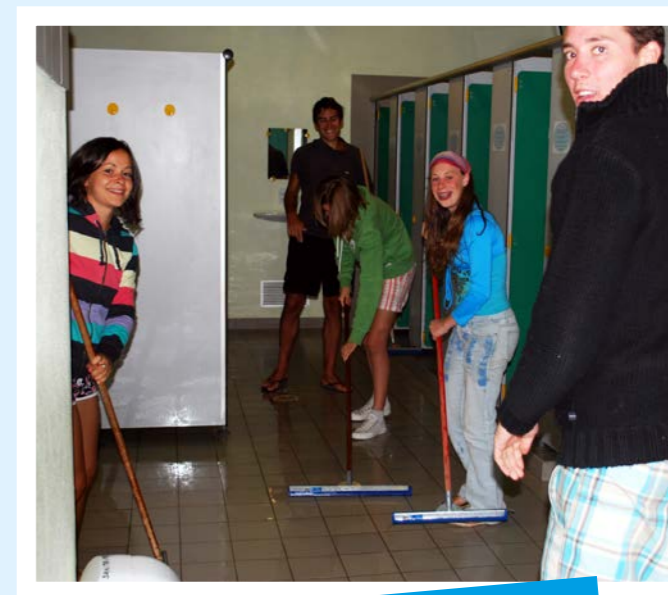
Entretien courant des bâtiments sanitaires

Pour chaque terrain GCU, un délégué de terrain bénévole est chargé de la surveillance et de l'entretien des installations ainsi que de toutes les démarches nécessaires au bon fonctionnement du terrain, du contrôle des travaux et de la préparation du camping avant son ouverture.