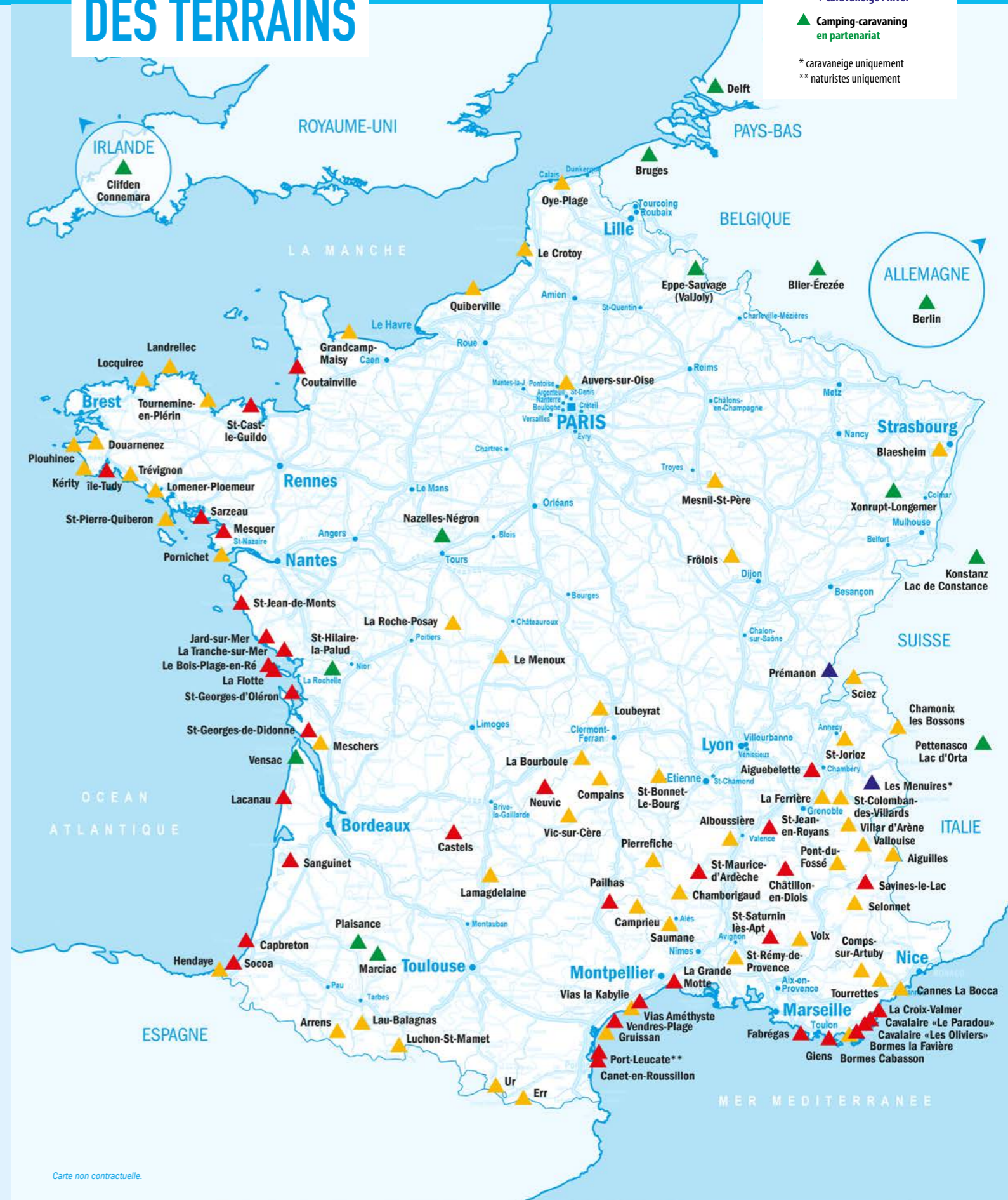
Carte non contractuelle.