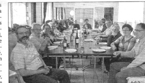
Les adhérents marnais se sont retrouvés au Foyer rural pour faire le bilan.

L'association compte une centaine de campings en France, où sont implantés de nombreux équipements, et qui organisent