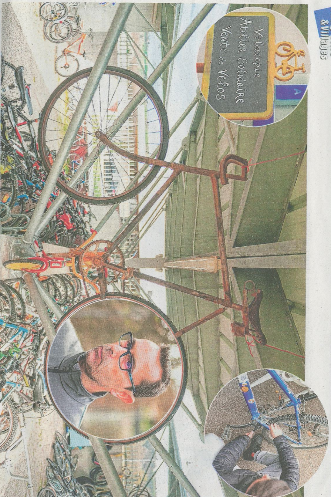
Les jeunes mettent les mains dans le cambouis dans cette caverne d'Ali Baba située à l'entrée du collège.

(en partie à vélo !), au musée du vélo à Saint-Etienne. Dans la continuité des actions de Véloscopie, les éco-délégués du collège, qui œuvrent en faveur du développement durable, sont super dynamiques. Au cœur de l'établissement, il y a un jardin potager, un compositeur, des mangeoires pour les oiseaux, un frugal truck (une estafette de 1969), où les bonnes actions donnent droit à des étoilles et sont récompensées, si on le souhaite, par des brioches locales, une boisson chaude ou un sirop. Pour consommer moins, mais mieux, et avec du sens. Par Marion GAUGE-ROUSSELOT