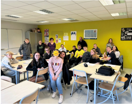
« Mon ESS à l'École » – L'association Les Acolytes au Collège Le Trion, à Samer (62)