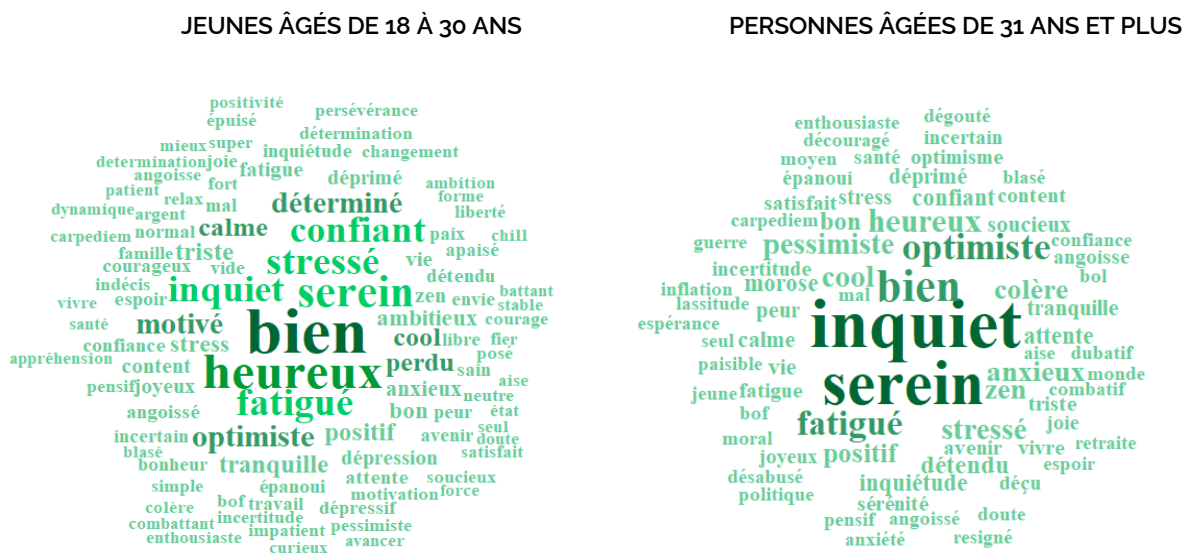
FIGURE 1. QUEL MOT (OU PHRASE COURTE) DÉCRIT LE MIEUX VOTRE ÉTAT D'ESPRIT ACTUEL ? (QUESTION OUVERTE)