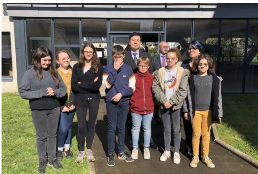
Les enfants ont présenté leurs projets aux élus.