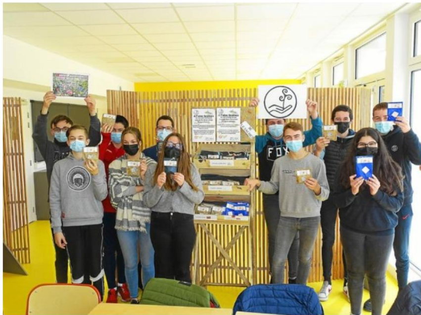
Les mini-entrepreneurs ont reconstitué les stocks de balles de graines et font intensifier les ventes au printemps, propice pour jeter les balles et laisser germer sans oublier d'arroser si le temps est sec.