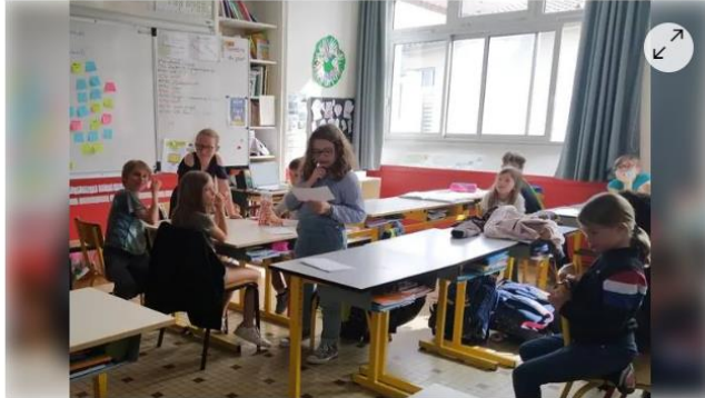
Les enfants ont pris leur travail très au sérieux. |