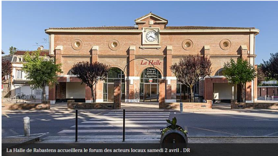
La Halle de Rabastens accueillera le forum des acteurs locaux samedi 2 avril .

Ouest-France : 28 mars 2022 : Cerizay. Une collecte solidaire cette semaine (ouest-france.fr)