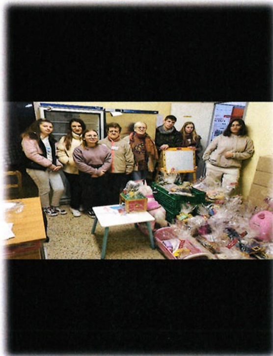
Les élèves avec les responsables de la Croix-Rouge lors de la distribution