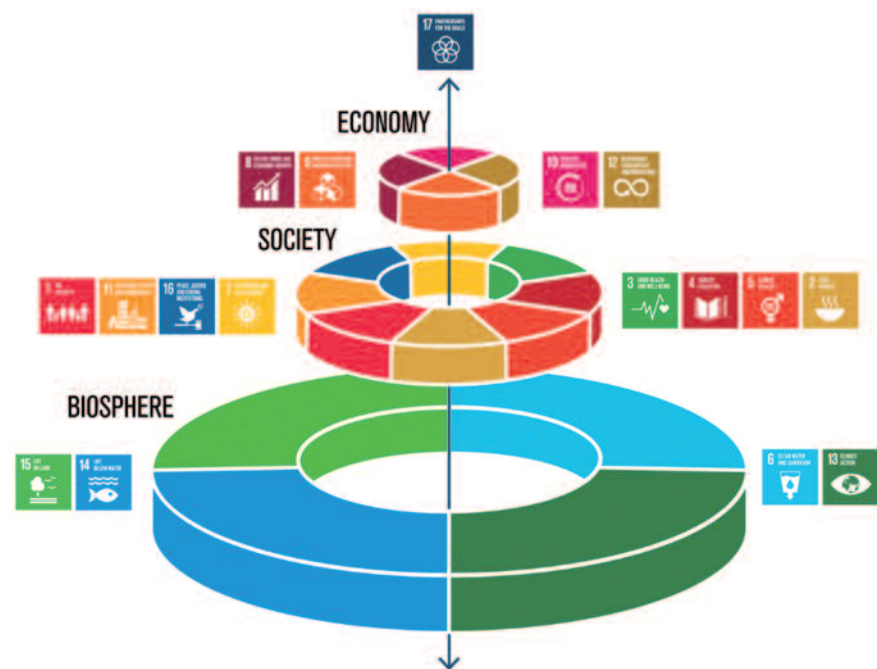
Figure 2 : Illustration structurée des ODD, pour signifier que les économies et les sociétés sont intégrées dans la biosphère et non distinctes d'elle.

Suite à ces alertes, l'ONU a créé en 2012 la Plateforme intergouvernementale scientifique et politique sur la biodiversité et les services écosystémiques (IPBES), souvent surnommée le « GIEC de la biodiversité ». Cet organisme évalue les connaissances scientifiques sur la biodiversité et les services écosystémiques, et fournit des conseils politiques fondés sur ces évaluations.